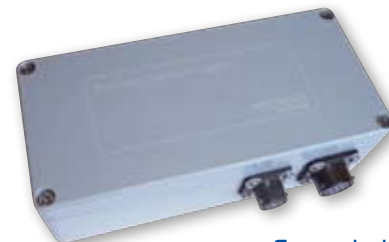
Coup de bélier